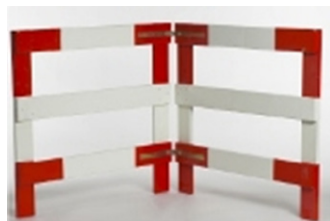
BARRIÈRE PORTEFEUILLE EN BOIS Réf: BAR420