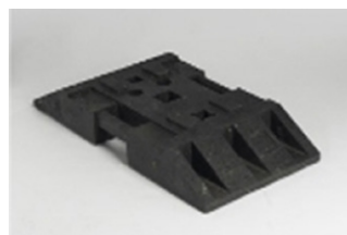
SOCLE UNIVERSEL K1, 31 KG Réf: BAL489