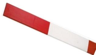
LATTE BARRAGE EN BOIS LONGUEUR 400CM Réf: lat440