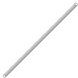
TUBE GALV. 1 » X 100 CM, POUR SUPPORT PL 100 Réf: TRE321