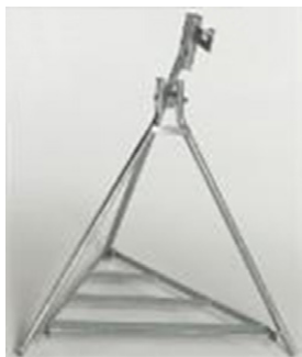
TRÉPIEDS GALV. PL100 AVEC GRILLE DE LÉSTAGE ET PORTE-LAMPE Réf: TRE320