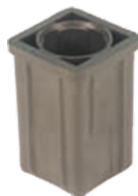
PLOT RÉDUCTEUR Réf: LAT449