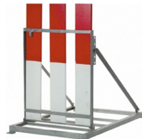
SUPPORT À LATTES EN ACIER GALVANISÉ Réf: SUP410