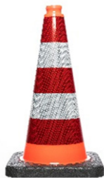
CÔNE 50 CM, R2, 2,2 KG Réf: CON522