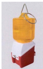
LAMPE 360°, SANS PILE Réf: LAM 1401