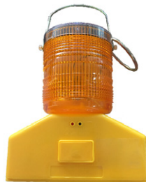
LAMPE SOLAIRE 360° Réf: LAMSOL.360