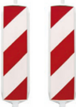
BALISE U21, BORD DE ROUTE, R2 Réf: BAL486