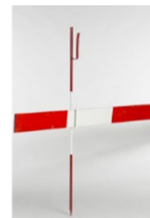
PIQUET PORTE LATTES ROUGE/BLANC Réf: lat445.5