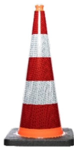
CÔNE 75 CM, R2, 4,2 KG Réf: CON531